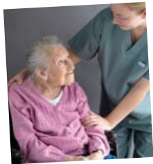
Uw welzijn, onze zorg.