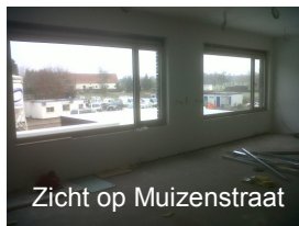
Zicht op Muizenstraat