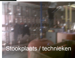
Stookplaats / technieken