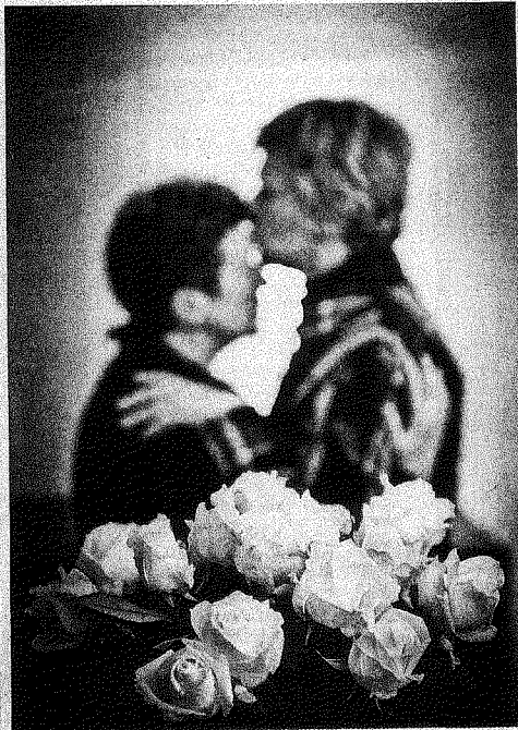
'Heel wat lesbiennes leven in armoede.'