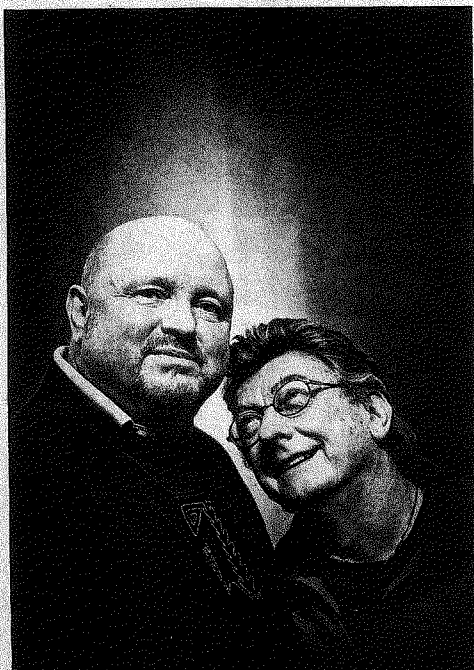
'De steun van mijn vrouw heeft het gemakkelijker gemaakt.'

daarom met het Janusproject holebiseksualiteit op de agenda zetten van de ouderenvoorziening. In april start de tentoonstelling 'Liefde is altijd goed' over holebi's van alle leeftijden, in dienstencentrum Ten Gaarde in Antwerpen. Op de 15de verjaardag van Het Roze Huis laten we enkele oudere holebi's aan het woord. JOCHEN VANDENBERGH, FOTO'S JIMMY KETS